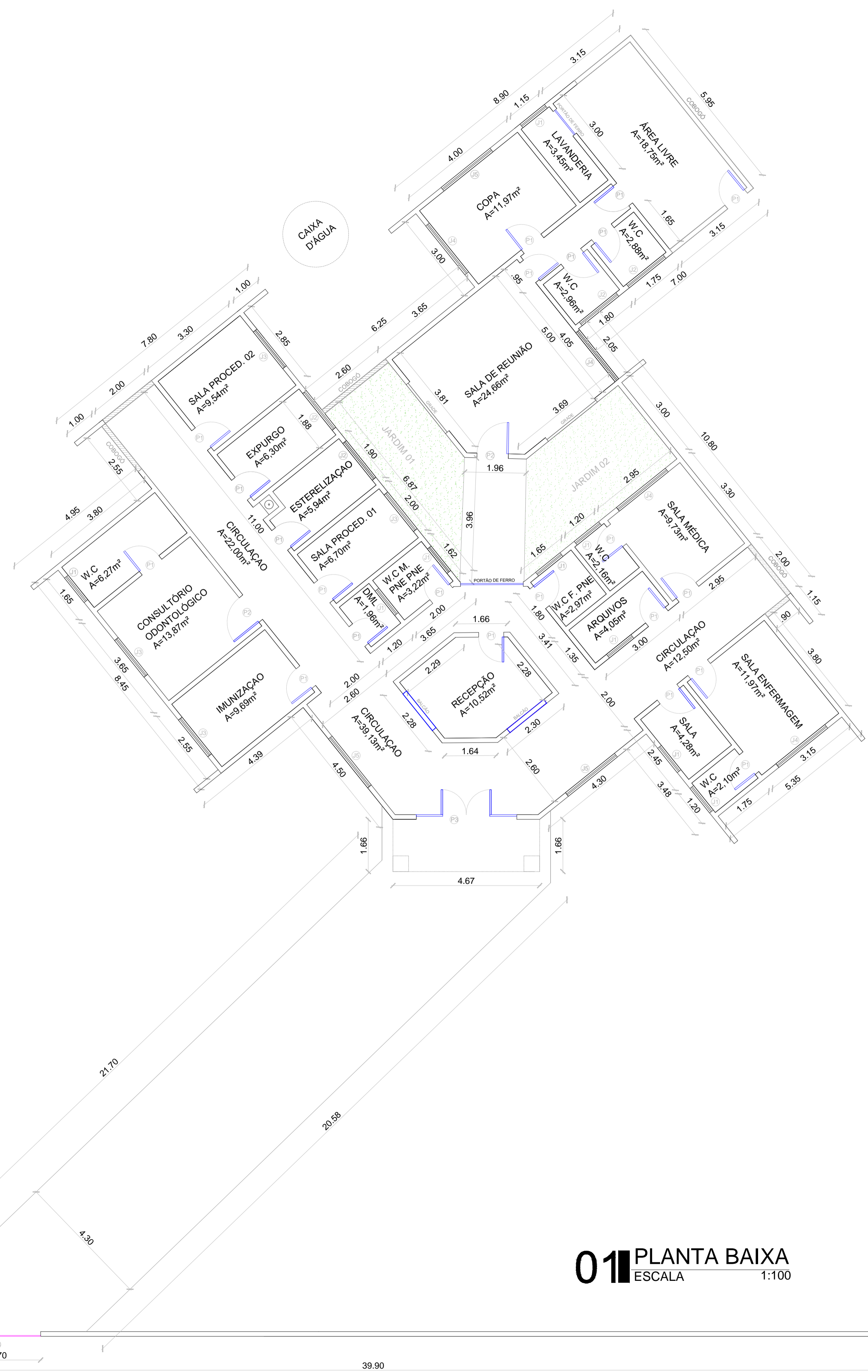
01 PLANTA BAIXA ESCALA 1:100