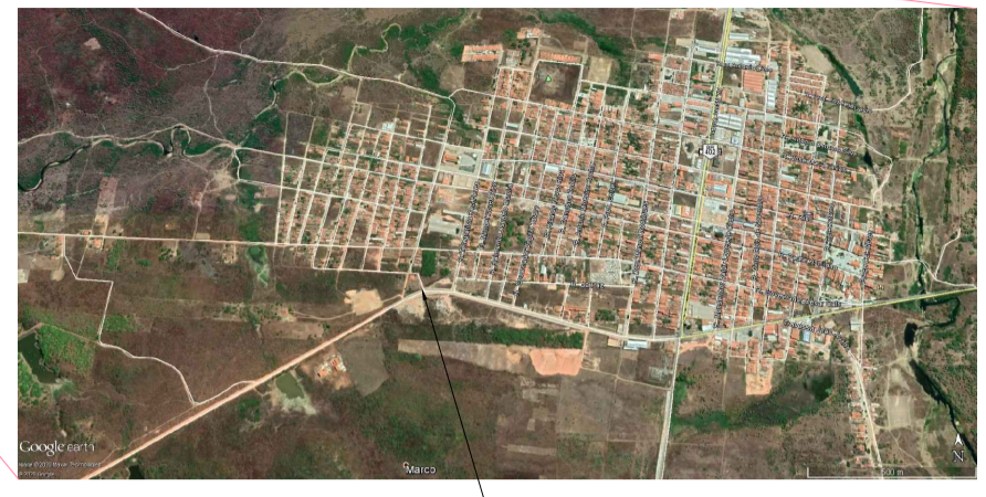
SAIDA PARA ESTRADA VICINAL X:31297,68 Y:9654600,43