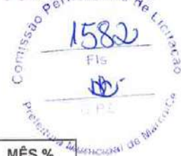
TABELA DE ENCARGOS SOCIAIS