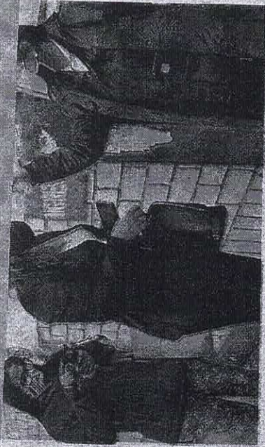
PERUANOS voltam às urnas para decidir futuro presidente

Sua adversária, Keiko Fujimori, que participou de um café da manhã em família na encosta de uma colina de um bairro pobre chamado de San Juan de Lurigancho, em Lima, também afirmou que reconhecerá o resultado da votação, algo que