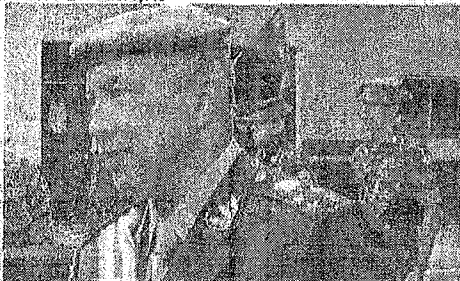
GENERAL Júlio Cesar Arruda, comandante do Exército exonerado