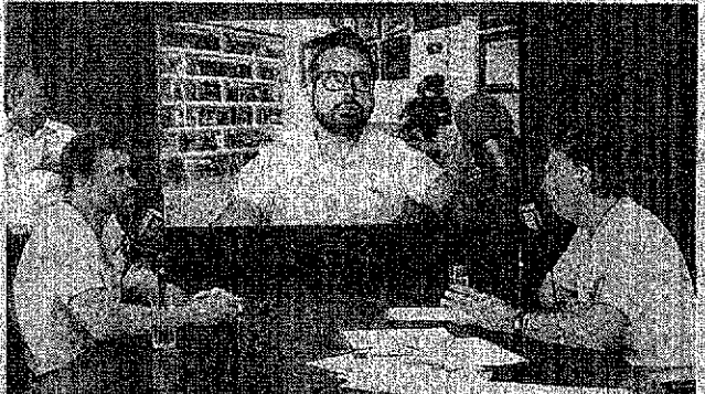
BOLSONARO na Live com Tiago Asmar (o “Pílhado”) e Paulo Figueiredo

O chefe do Executivo defendeu que as pessoas votem “pelos filhos, pela família” e pediu para que, se possível, usem roupas verdes e amarelas no dia da votação. As cores da bandeira do Brasil e camisas da seleção brasileira são relacionadas ao apoio ao governo atual. “Quero continuar presidente