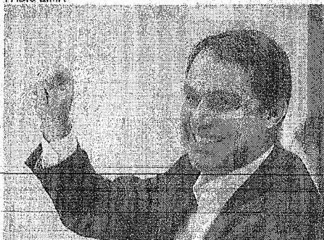
SALMITO assume Desenvolvimento Econômico