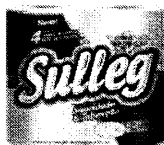
Papel Higiênico SULLEG FOLHA DUPLA 4 ROLLOS 30M