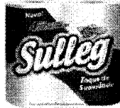
Papel Higiênico SULLEG FOLHA SIMPLES 4 ROLOS 33M