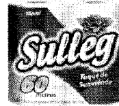
Papel Higiênico SULLEG FOLHA SIMPLES 4 ROLOS 60M