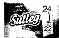
Papel Hig-ênico SULLEG FOLHA DUPLA Leve 24 Pague 22 - 30M