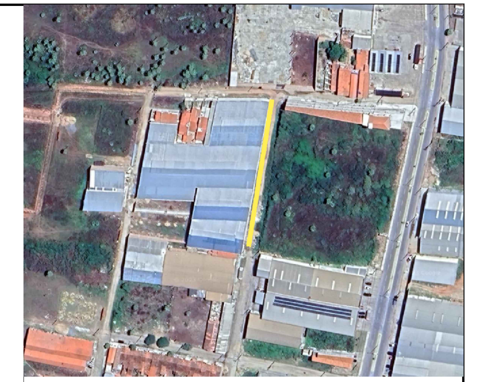
LOCALIZAÇÃO GOOGLE EARTH