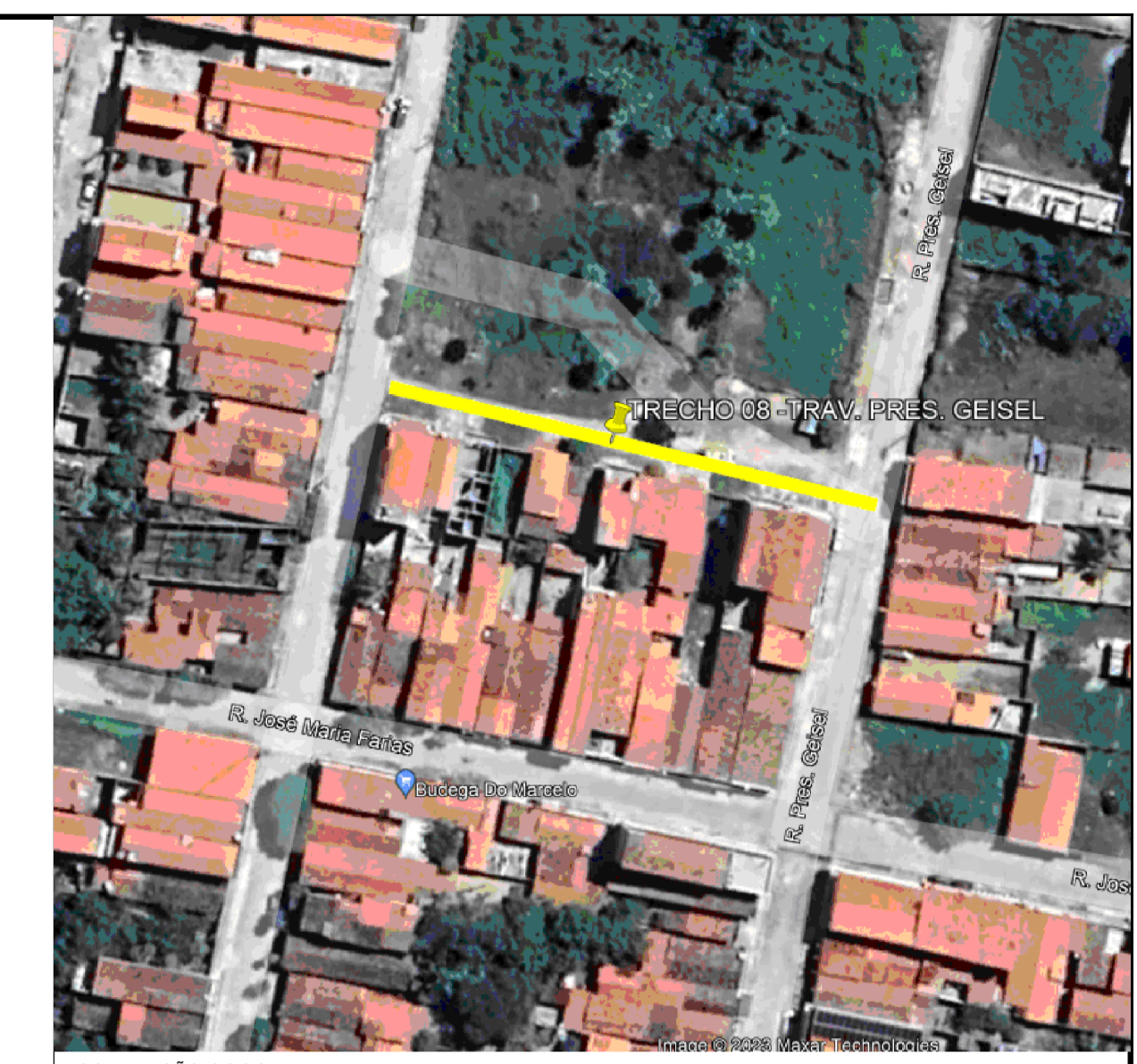
LOCALIZAÇÃO GOOGLE EARTH