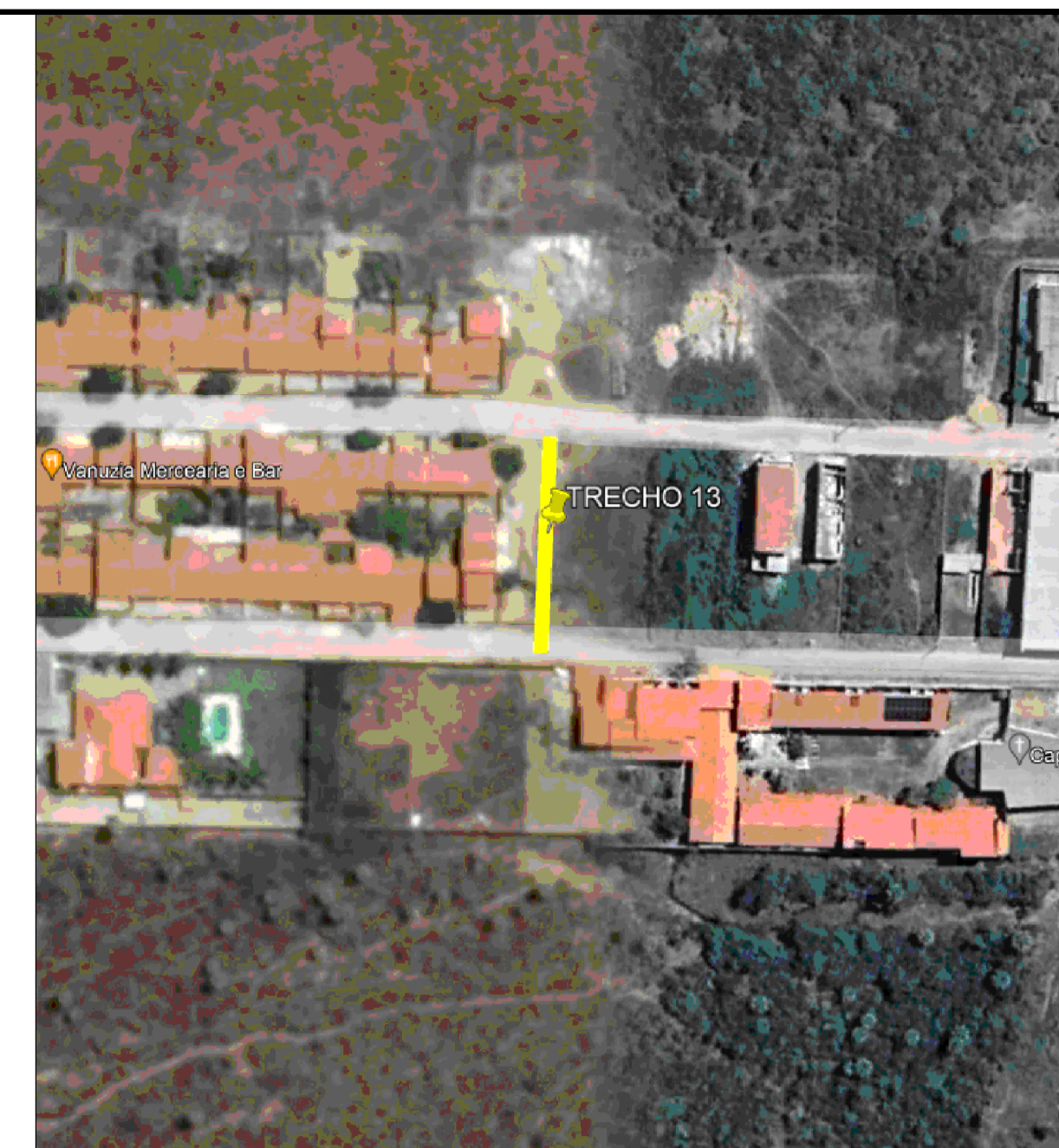
LOCALIZAÇÃO GOOGLE EARTH