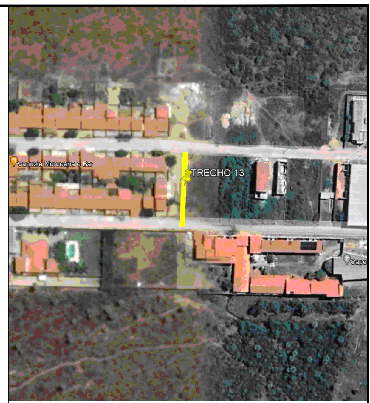
LOCALIZAÇÃO GOOGLE EARTH