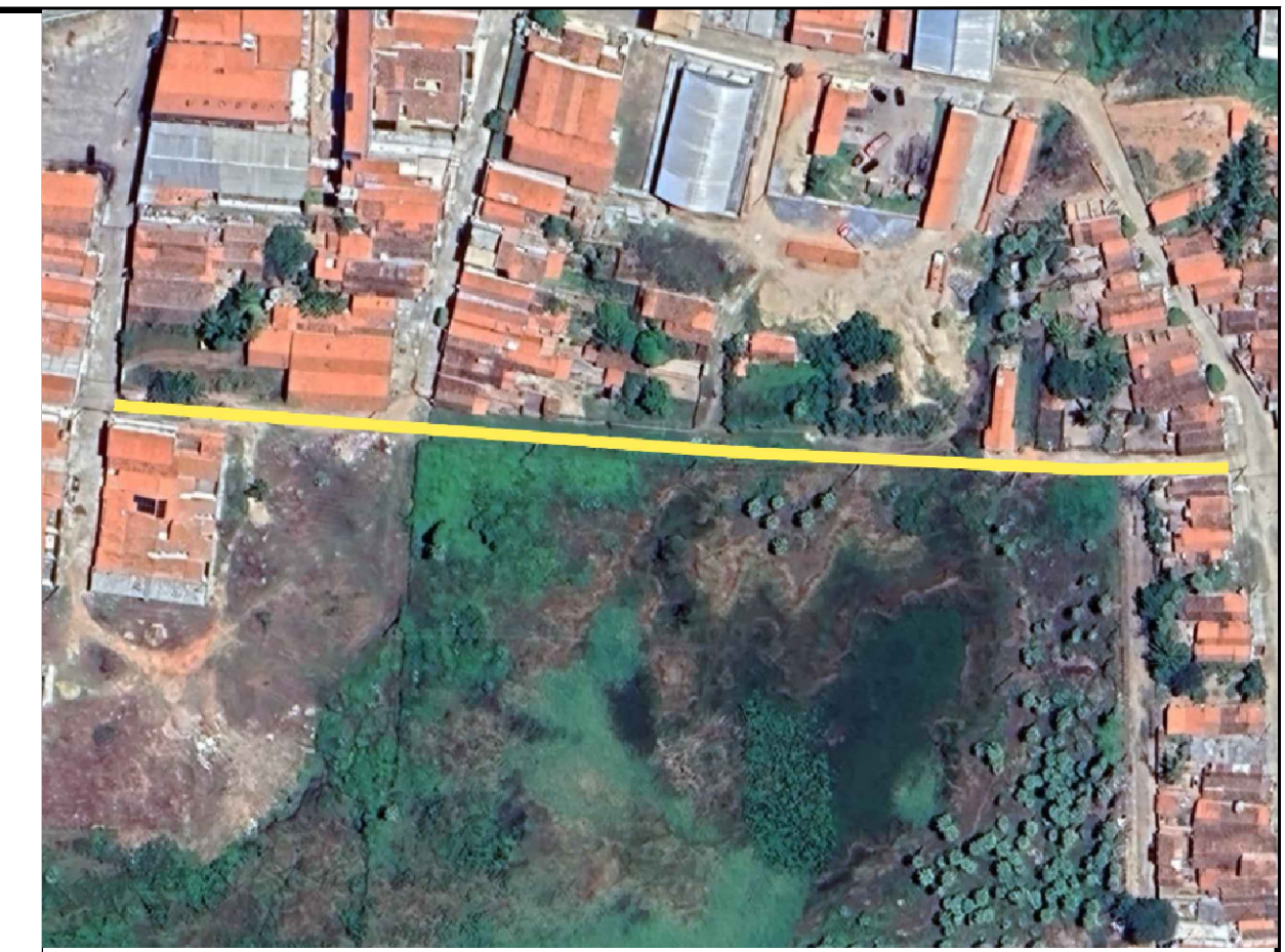
LOCALIZAÇÃO GOOGLE EARTH

ESTACA FINAL: E-30+3,05m A CADA 5 metros